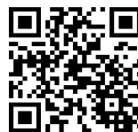
アカウント作成ページ

オンライン申請のためには、 アカウントの作成が必要です。 アカウントを作成し、マイページにログインします。